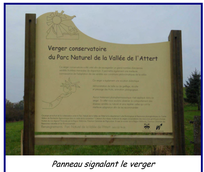
Panneau signalant le verger

Contact : Dominique Scheepers PNVA 063/22 78 55