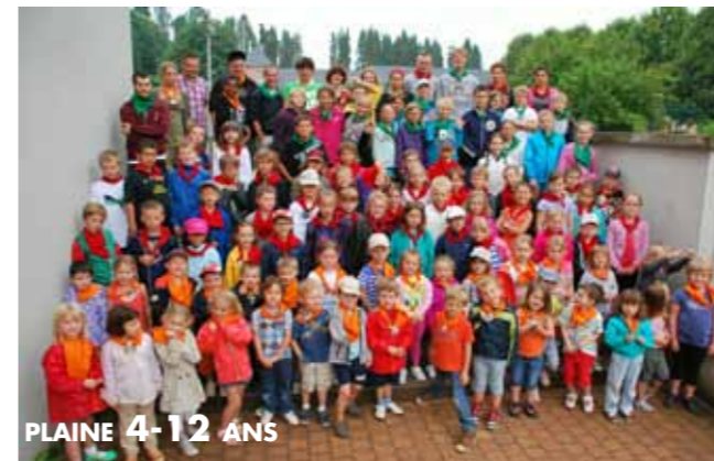
PLAINE 4-12 ANS

Rendez-vous l'année prochaine pour de nouvelles aventures !