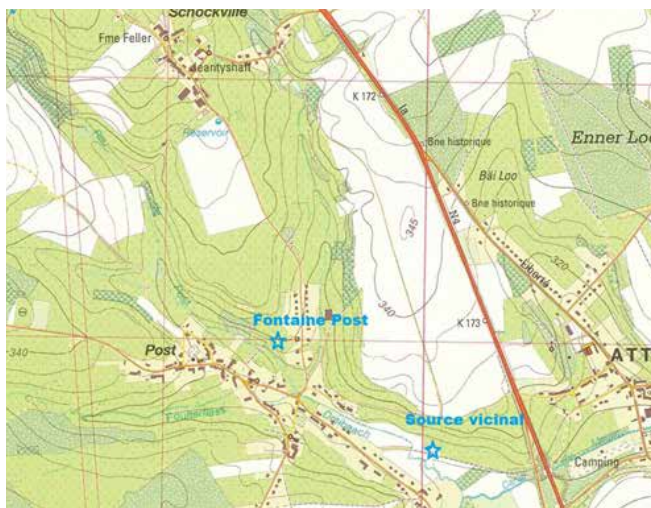
Localisation des sources (sur fond de carte IGN 68/3-4)

La nappe est alimentée par l'infiltration de l'eau de pluie sur les surfaces à l'amont des sources, soit le plateau agricole entre Post et Schockville, et la zone de cultures le long de la N4 entre Post et Attert.