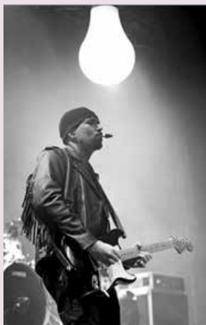
Edo - guitar, backing vocals, keyboards « The Edge »